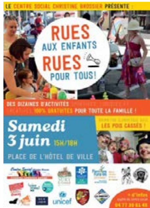
Sury-le-Comtat juin 2023