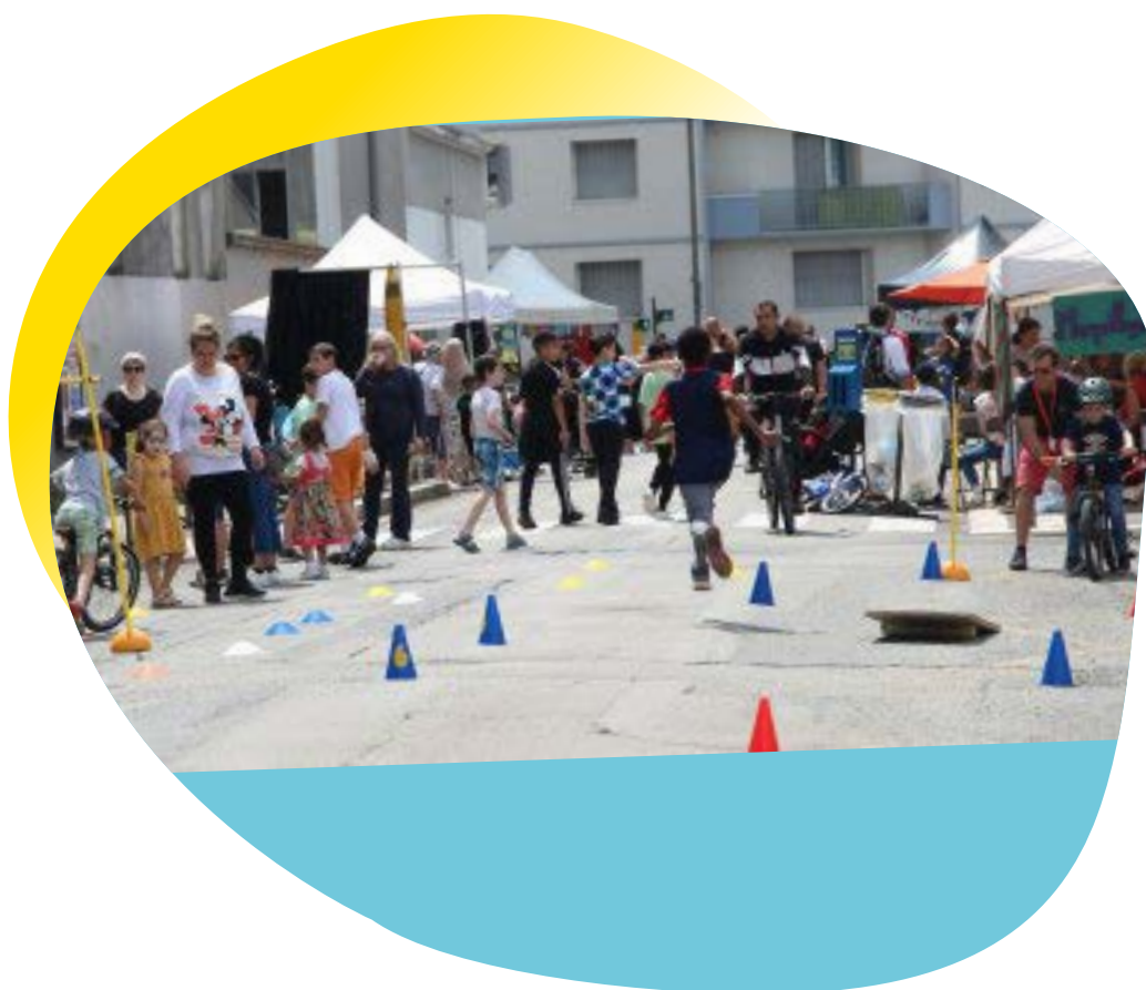
Grenoble - Ecole Jules Ferry