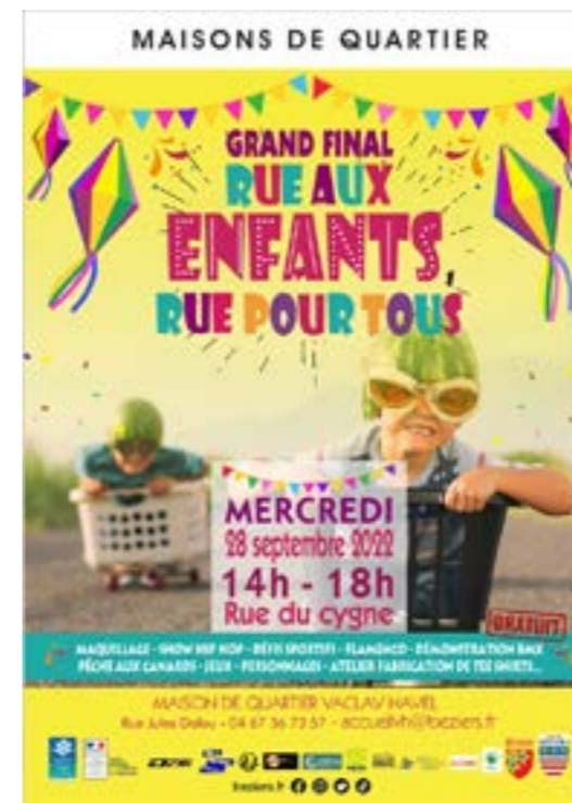
Maison de Quartier Vaclav Havel