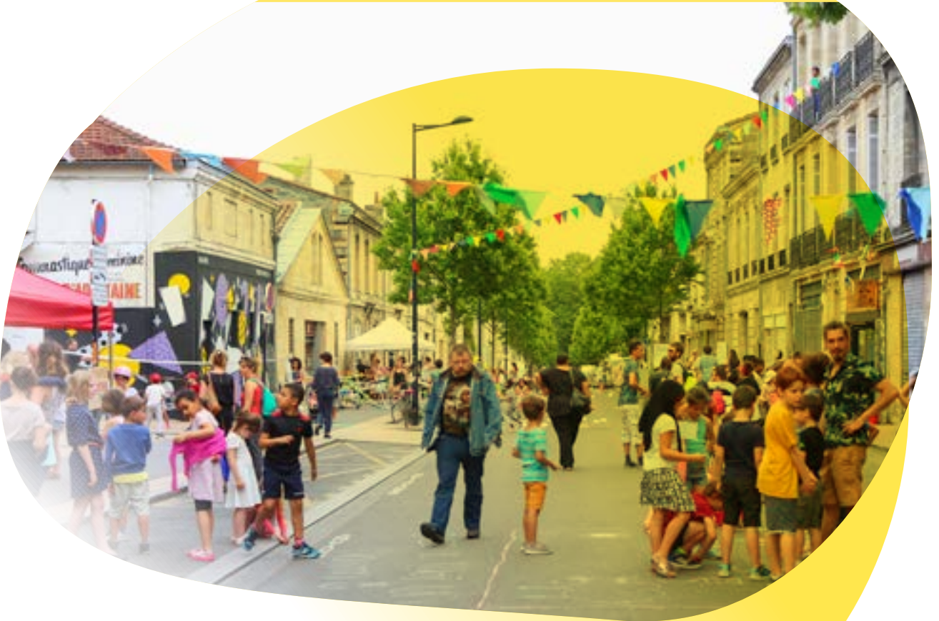
Bordeaux - Quartier Saint Michel - Crepaq